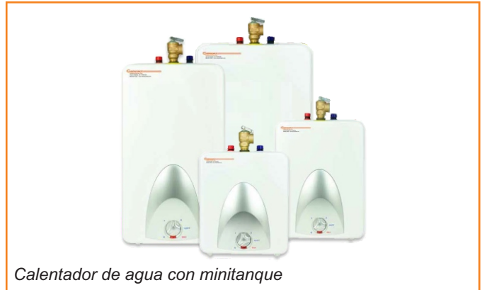
Calentador de agua con minitanque

Los calentadores de agua con minitanque Chronomite se pueden utilizar en la mayoría de las aplicaciones bajo cubierta, punto de uso. Los modelos CMT-1.3, CMT-2.5, CMT-4.0 y CMT-6.0 están diseñados para suministrar agua caliente para todos los lavamanos y fregaderos de cocina en un entorno residencial, comercial o industrial. Estos calentadores pueden reemplazar a los calentadores de agua caliente centrales tradicionales, ahorrando así agua y reduciendo el desperdicio de energía. Los calentadores de agua con minitanque Chronomite son ligeros, compactos, fabricados para facilitar su instalación y diseñados para montarse en la pared.